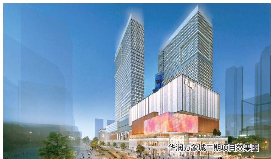
华润万象城二期项目效果图