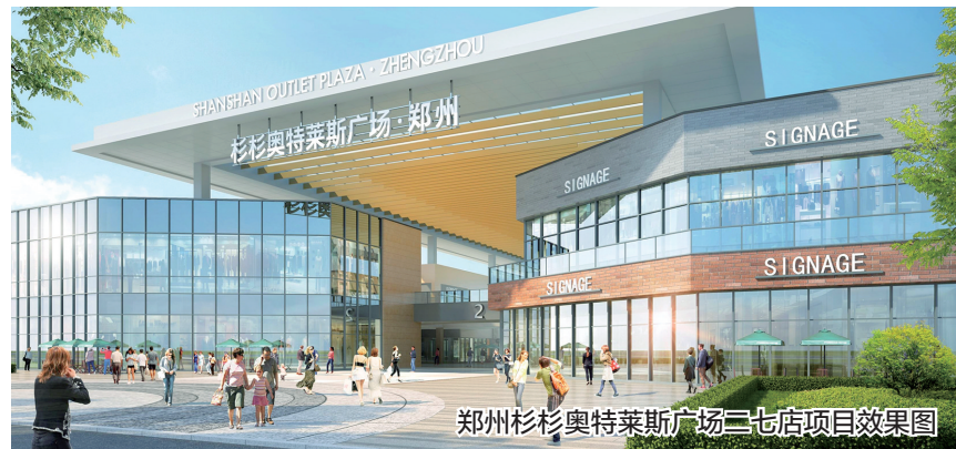
郑州杉杉奥特莱斯广场二七店项目效果图

接下来,二七区继续全力以赴拼经济,加压奋进求突破,重大项目建设加速提质,为高质量建设现代化美好二七注入强劲动能。