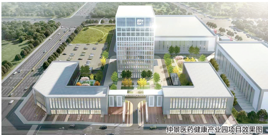
仲景医药健康产业园项目效果图

据了解,该项目招商工作也于今年9月份正式启动,目前已达成意向合作品牌超百家,开业运营后首年将引进国内外知名品牌超230个。项目运营达产后,预计营业额超20亿元,年税收约5000万元,提供从业人员岗位约1500个。