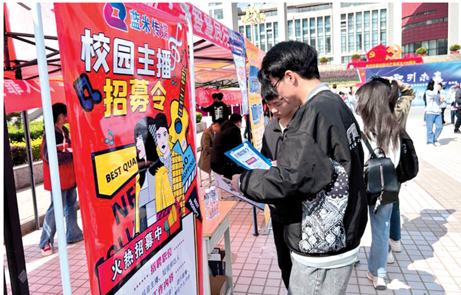
专场招聘会进校园

接下来,该局还将继续走进黄河科技大学等高校,一对一为高校毕业生提供就业创业政策咨询等服务,推进青年人才在二七区创新创业,缓解企业“用工难”,为高质量建设现代化美好二七提供良好就业服务环境。