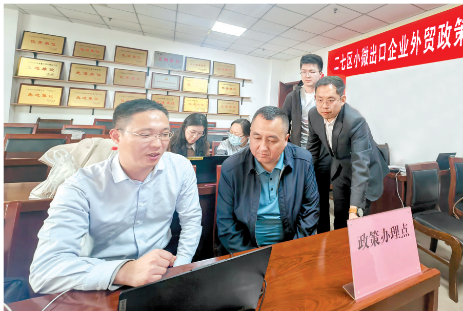
二七区小微出口企业外贸政策申领活动