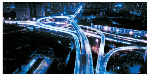
高山路立交桥夜景