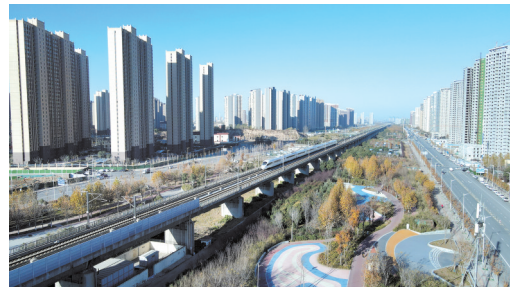
大学南路上的高铁沿线