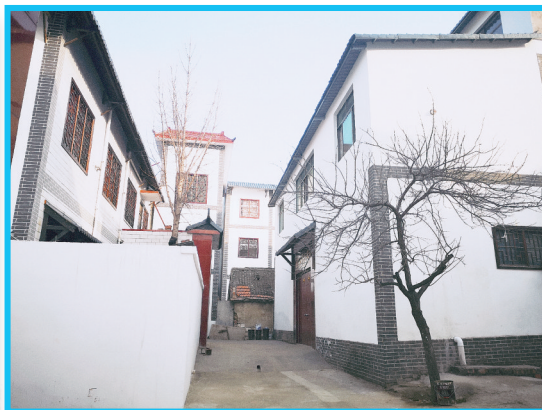
马寨镇申河村被改造之后颇具江南风情的民居

自郑州市“双改”工作开展以来，二七区委、区政府高度重视，坚持“治标”整治与“治本”谋划同步推进，加快节奏，集中攻坚，“三项工程一项管理”工作初显成效，特别是城乡接合部综合改造工作，发生了“一天一个样、每天不一样”的变化。