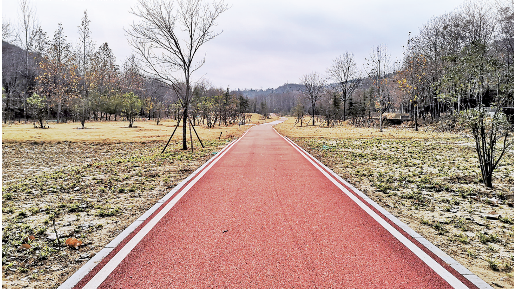
马寨镇改造后呈现美丽城乡画卷