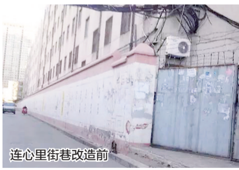
连心里街巷改造前

在路长制市容市貌大提升背街小巷改造中,淮河路街道将其列为首批改造名单,以“温暖回家路”为理念制订了改造方案,对其进行了包括道