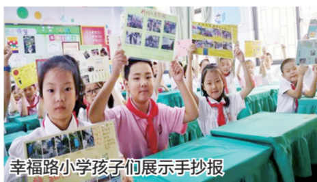
幸福路小学孩子们展示手抄报

“我感觉精细化就是让我们的学校越来越美。”我看到家门口和学校两边的街道都种上了各种各样的花,特别漂亮。”现在上学不用爸爸妈妈送到学校门口了,我可以跟小伙伴们一起走,特别开心。”我最羡慕的就是我们幸福路小学的小交警,我要好好学习,争取也成为一名小交警。”