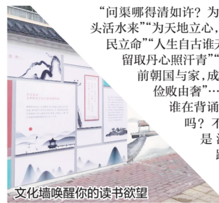
文化墙唤醒你的读书欲望