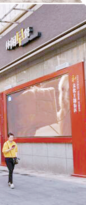
建中街办事处微景观游园

在建中街街道,“和”文化主题街区亮相,“人心和善”“环境和美”“社会和谐”等宣传语让人看了之后瞬间平静;“仁”文化主题街区中可以看到关于感动中国人物胡佩兰的事迹;二十四节气文化街区更是让人眼前一亮。