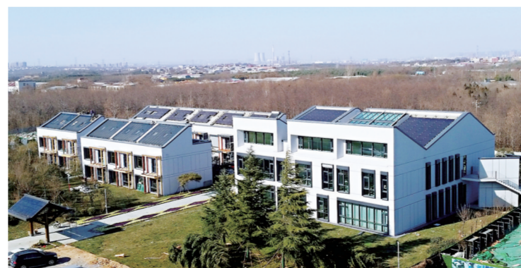
樱桃沟景区西南建筑艺术体验馆

樱桃沟景区位于郑州市西南,距主城区15公里,生态资源丰富,被誉为“郑州市城区生态后花园”,是“田园二七”的核心部分。“近年来,我们充分利用辖区优势,以景纳入、以景促进,大力发展以文旅