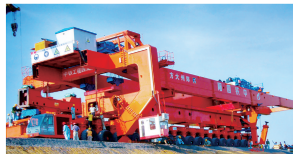
新大方生产的架桥机领先世界