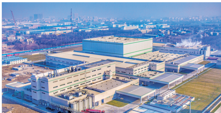
马寨产业集聚区快速发展

20世纪80年代,以东方挂面厂、天方方便面厂为龙头的乡镇企业在马寨异军突起,逐渐发展壮大,形成集群效应,带动了马寨及周边的迅速发展。多年来,马寨产业集聚区历经传统产业提档升级、大力引进新兴产业,一个工业老镇逐渐演变为产业新城,不断焕发着新的生机。