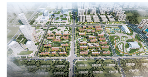
万科健康医疗养生小镇项目效果图