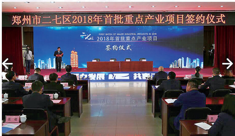
郑州市二七区2018年首批重点产业项目签约仪式

3月27日上午,二七区举行2018年首批重点产业项目签约仪式,共签约重点产业项目8个,总投资额达690亿元。 记者 景静 通讯员 郭佳星/文