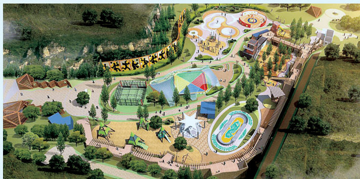
全龄智能运动公园项目效果图