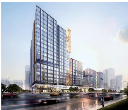
融侨悠乐汇项目效果图