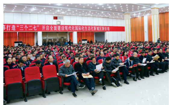
参会的各单位代表