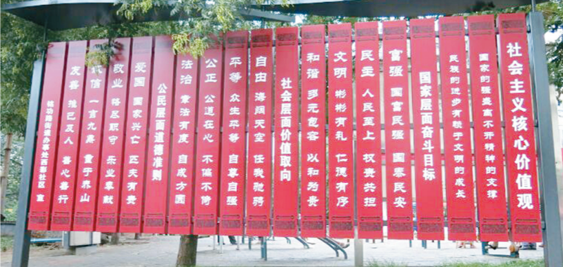
铭功路街道西彩社区

产形势逐步好转。上半年全区共排查治理生产经营单位 6389 家,排查出各类事故隐患 7143 项,整改率 96% 。