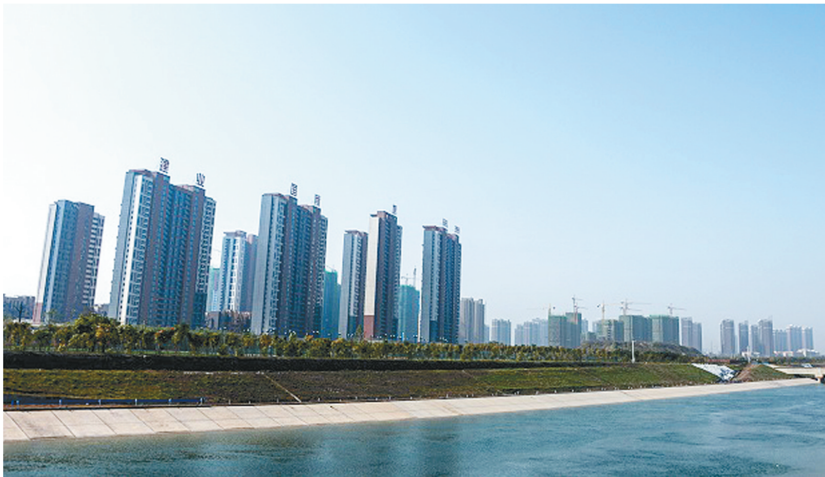
南水北调带状公园风景如画

项目共计完成投资 94.3亿元 ,占年度计划的 48.7% ;完成联审联批审批事项 16项 ,占年度计划的 80% ;集中开工了融侨欢乐汇等 75个 重点项目,省市重点项目完成投资、开工率市内六区 第1 。全区 150个亿元 以上重大项目完成投资 170亿元 ,占年度计划的 36% 。盛润运河城国际广场、南水北调中线防洪工程等 17个 项目已顺利开工建设。