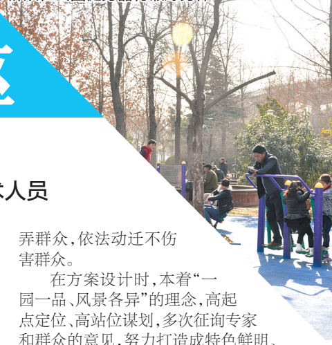
群众在公园健身器材锻炼身体