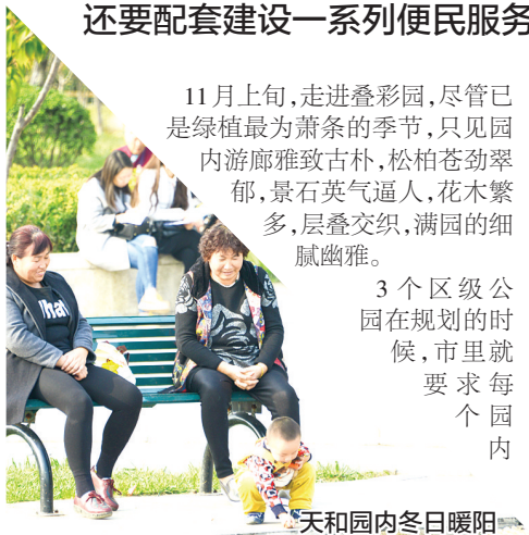
天和园内冬日暖阳