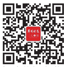
扫一扫关注二七时报