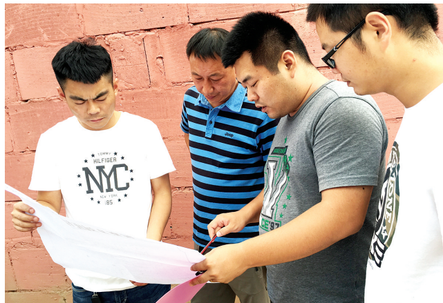
实地查看绘制制迁进度条

在这批历练干部中,大多数是80后、90后的年轻人,多数人员为机关单位的“久坐族”。到村庄之后才发现,乡镇的工作不同于机关,和村民、商户感情的建立,靠的就是一声声问候、一次次拜访,“土小”企业的整治、拆迁清零的统计,靠的是一次次上门督促、一遍遍地实地测量,原来有一种工作模式叫做“行走着的一天”。