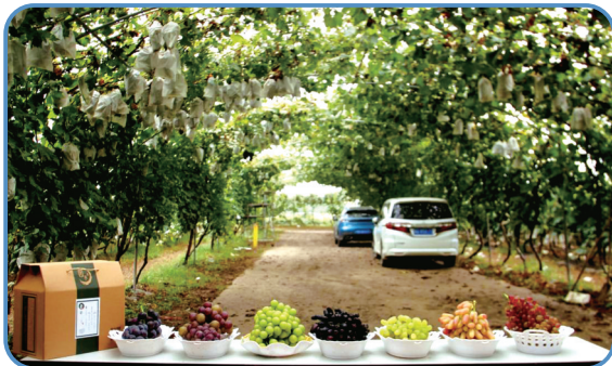
凤栖南路园亭葡萄采摘园