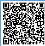
扫码看28项 文旅活动安排

另外,二七区的多彩之秋别有一番景致,快来开启一场说走就走的秋日之旅吧。 记者 景静 通讯员 李静涵 李月 文/图