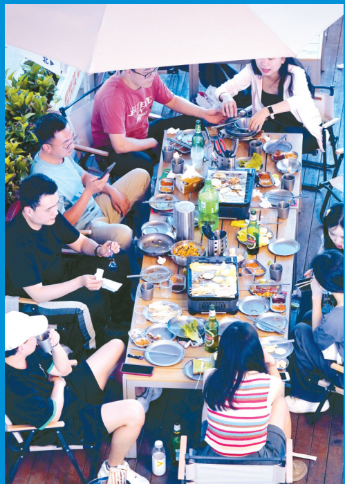
夏夜的露天大排档是最聚拢人气的地方