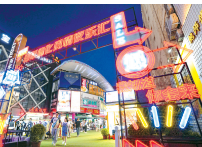
德化街夜晚灯光璀璨