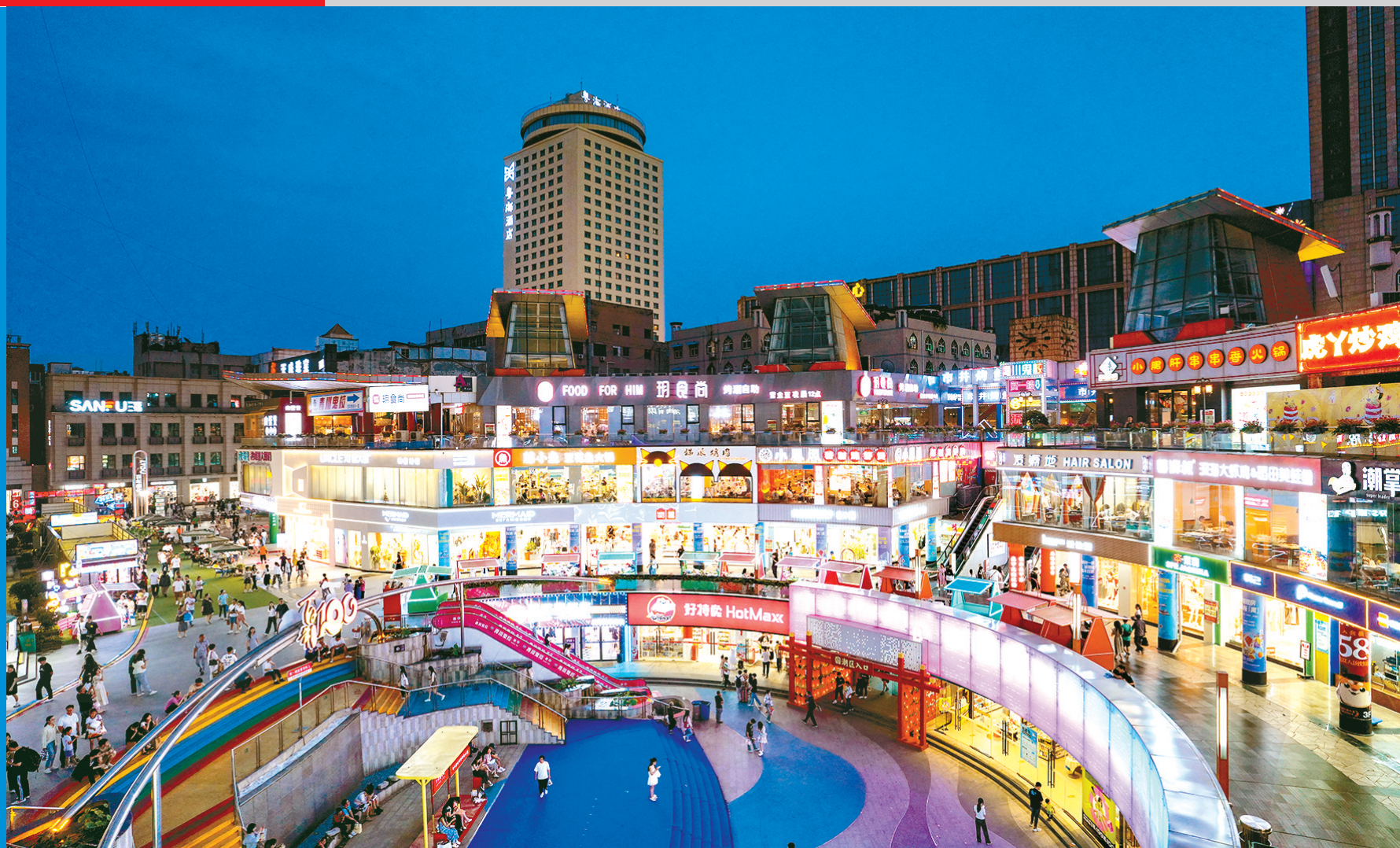
繁华的百年德化商业街区霓虹闪烁